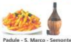
Padule - S. Marco - Semonte