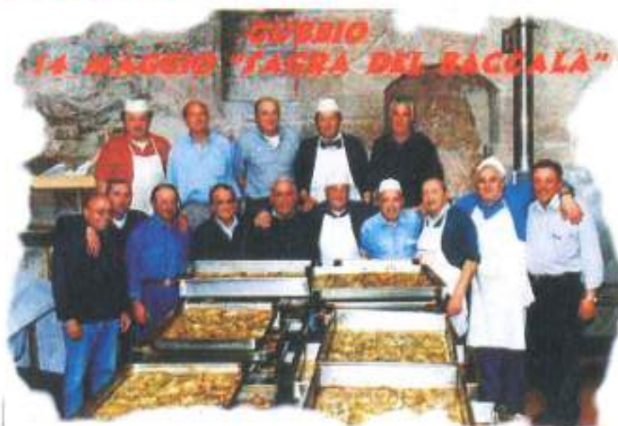
(Ndr) Questi me sà che stavolta se "picchero"

Visto su un portone dei "macelli" anno scorso