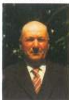
Il duce de Padule

Leggo su "Gubbio Oggi" della crisi che attraversa il Gazzettino del Broccero . Una crisi c'è stata anche a riguardo del Bollettino dei Santantoniani . Mi dispiace ma non sono problemi importanti per i Ceri che restano nascosti nella Basilica, e di cui le Famiglie ceraiole fino ad oggi non si sono preoccupate. Approfitto ancora del nostro storico "Via ch'eccoli" per chiedere del Museo Ubaldiano, per il quale la Chiesa Eugubina si è impegnata da tanto tempo. Fin da quando fu stilato con grande celebrazione sull'altare della Basilica, il patto con il Comune per la conduzione di tutto il complesso religioso.