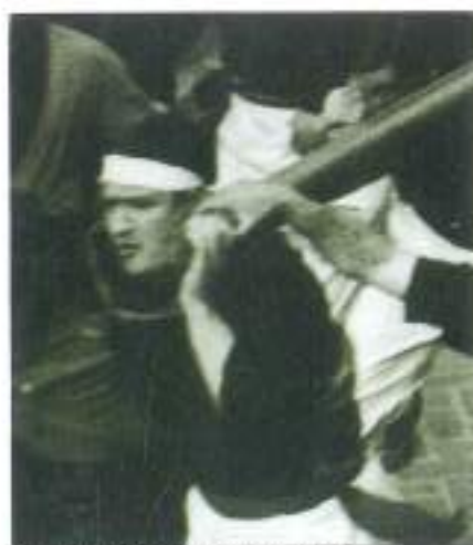
Corsa 1964, Rossetto, puntarolo kimbaze

L'anno scorso, 2006, c'è mancato poco che S. Antonio arcadesse per colpa mia. Puntuale come ogni anno da qualche decennio, mi son messo sul cantone della Trinità per far posto al passaggio dei Ceri e per facilitare il percorso al nostro ultimo. Mezz'ora prima mi metto lì e a facce non conosciute comincio a domandare: «Lei è di Gubbio»? Generalmente la risposta è «no». «Allora guardi che è pericoloso perché ci sono i cambi etc. etc.», e si spostano.