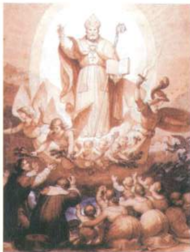
Tommaso Minardi, Sant'Ubaldo appare agli eugubini in adorazione . A destra, in fuga, sono raffigurati, ben visibili, sia il demone, sia l'armata rivoluzionaria.